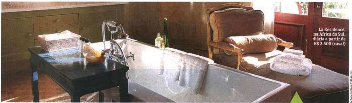
La Residence, na África do Sul, diária a partir de R$ 2.500 (casal)