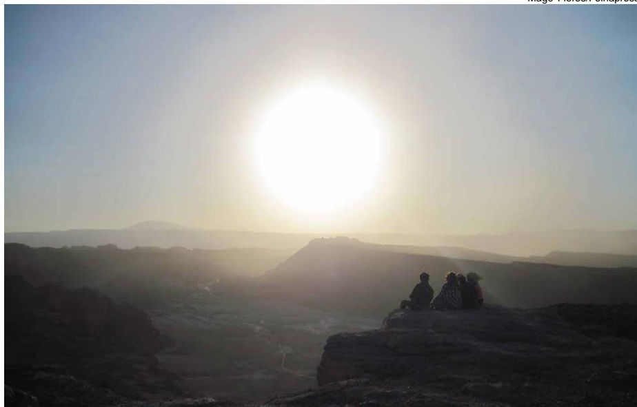
Turistas observam o pôr do sol no Vale da Lua