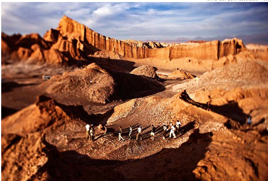
Turistas no Vale da Lua, no Atacama