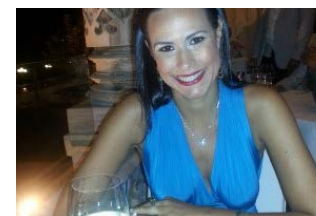
Istambul – Res...