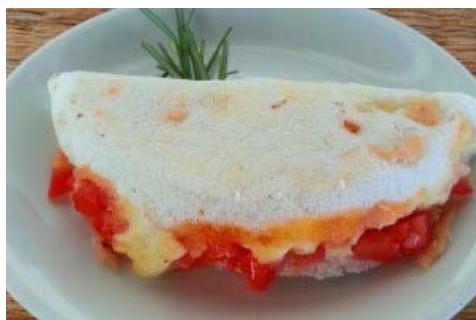
TAPIOCA – TUDO QUE SEI SOBRE ESSA DELÍCIA