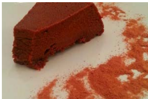
BRIGADEIRÃO – O MELHOR DOCE DE DIETA QUE J ...