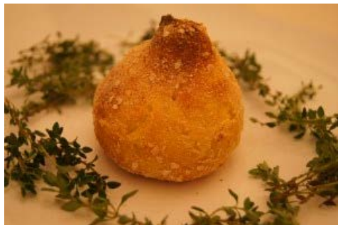
COXINHA FIT – SEM GLÚTEN – SEM LACTOS...