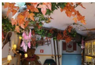
Pousada Canada Lodge...