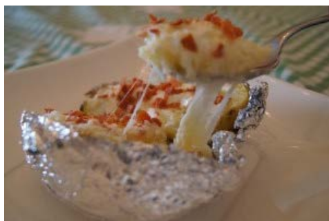
BAKED POTATO LIGHT