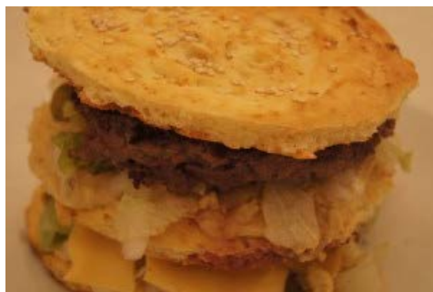
BIG MAC CASEIRO NO PÃO SEM GLÚTEN... LIGHT!