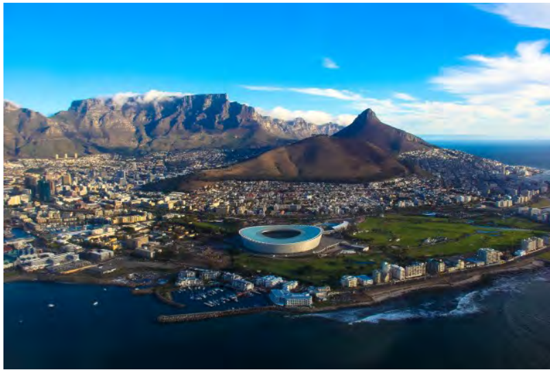
Vista aérea de Cape Town.

A África do Sul , oficialmente República da África do Sul , é um país localizado no extremo sul da África , entre os oceanos Atlântico e Índico , com 2.798 quilômetros de litoral. O destino é completo, pois oferece opções para todos os tipos de viajantes.