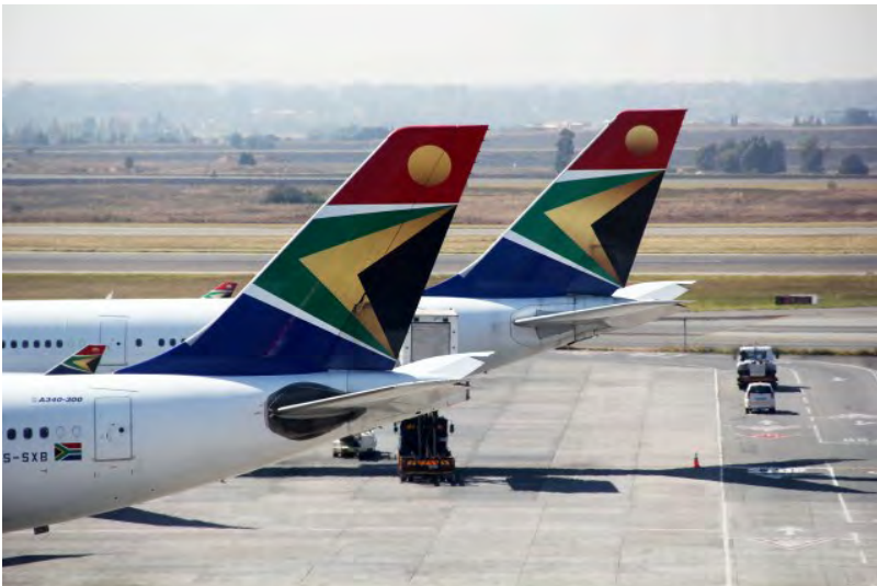
As aeronaves na pista.

A companhia aérea parcela as passagens aéreas em até 5 vezes sem juros e oferece a Classe Executiva , para quem deseja exclusividade do começo ao fim da viagem. Em São Paulo você usará o excelente lounge da Star Alliance e em Cape Town e Johannesburg o Premium Lounge , todos ótimos, com opções de alimentos e bebidas, banheiros completos com chuveiro e um serviço atencioso.