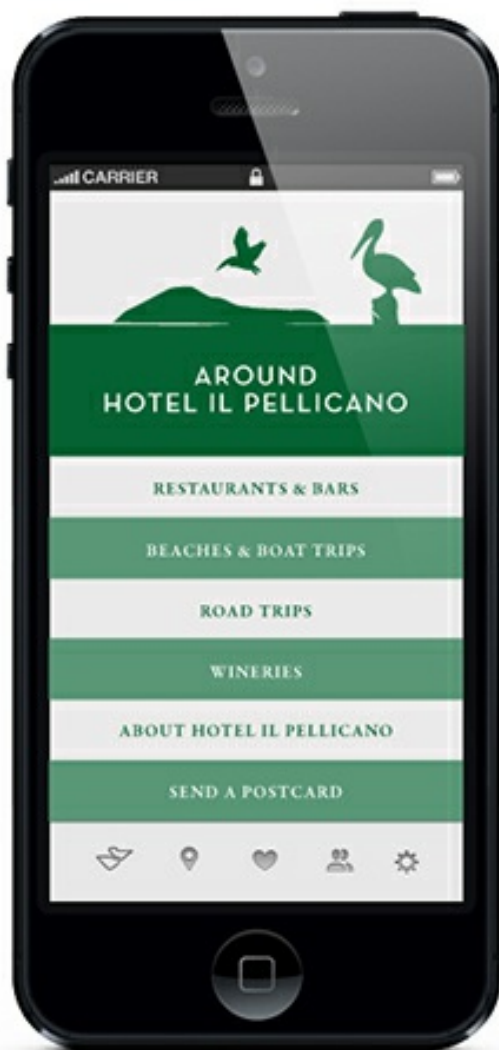
A interface do aplicativo